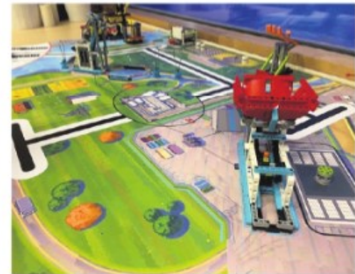
Der venter masser af udfordringer i FIRST® LEGO® League: Byg den robot, der hurtigst kommer igennem den todimensionelle bane.

- LEGO taler til en bred aldersgruppe, men vi ser også muligheder for i samarbejde med Coding Pirates at appellere til de unge med andre typer af programmering og kodning, slutter Jens Skov Jørgensen.