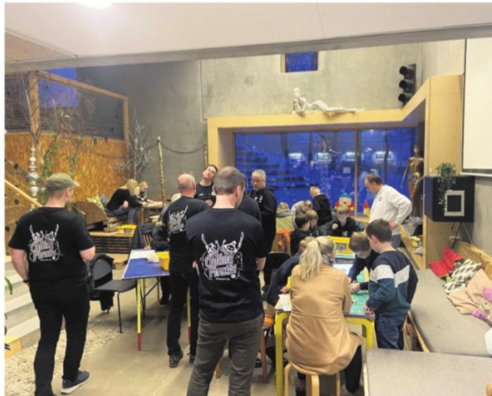
Der var et flot fremmøde af børn og forældre, ligesom de mange lokale frivillige hjalp børnene i deres arbejde med robotterne.